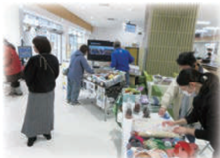
▲物品販売を通じて、制作の様子などお話をできていました。