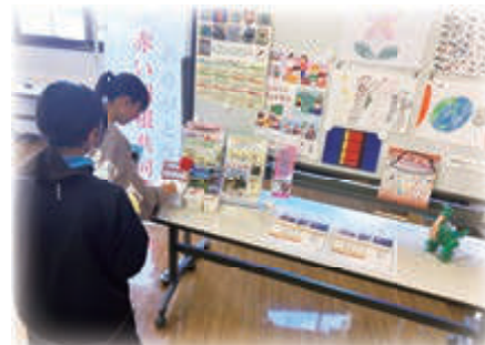
▲赤い羽根共同募金にご協力いただいています。

山陽会場では、12月3日～12月9日の「障害者週間」に合わせ、赤磐市役所で作品展を開催しました。