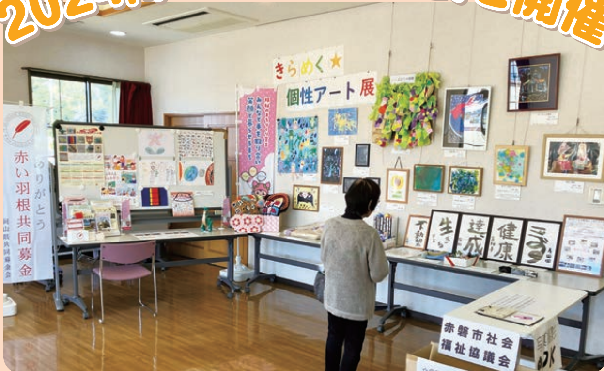
「きらめく☆個性アート展」では、障がいのあるかたが創作された個性豊かな力作が並びました。