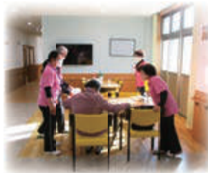
▲あかいわハートフル太陽に到着し、「入浴サポーター」へおつなぎします。