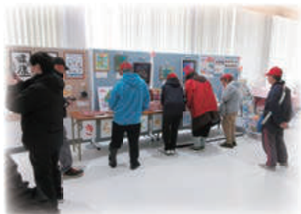
▲自身の作品や他のかたの作品を楽しまれています。