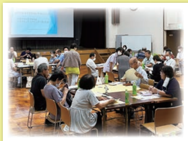
▲情報交換会の様子

参加者からは、「防災備蓄品を少しずつ購入していきたい」、「ご高齢のかたの避難方法を考えたいと思った」、「地区等で具体的な避難訓練を実施するの必要を感じた」等のお話がありました。第2回は実際の避難所となっている場所の施設見学や各種体験をしました。情報交換会の開催が、地区での防災活動や防災意識の向上につながって欲しいです。