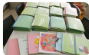
▲ご寄付いただいた点訳本