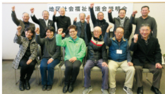
▲桜が丘東地区社協設立準備委員会の皆さん

今回出た意見を地区社協設立準備委員会でも話し合っていくことで地区の課題の共有につながります。