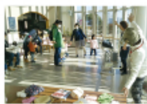
▲リトミックでは子どもたちだけでなく、お父さんお母さんも楽しんでいました。

他にも、マジック、保健師さんによる身長・体重測定、新聞プール、絵本の読み聞かせなど内容が目白押しでした!!