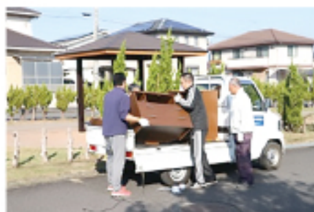
▲資源ごみ出しの様子