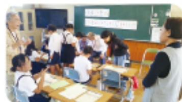
▲出前福祉講座での様子（豊田小）