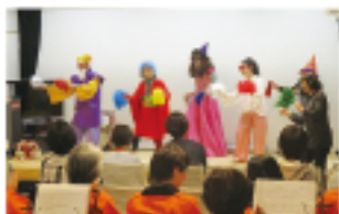
ボランティアフェスティバル

ボランティアに関する相談受付やボランティア活動の啓発及び育成支援を行っています。