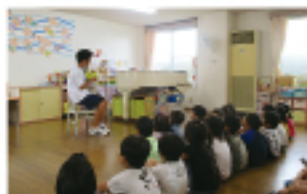
夏のボランティア体験事業 (絵本の読み聞かせ)