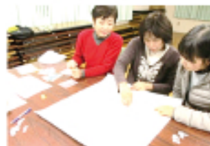
▲ご近所福祉ネットワーク活動 (マップづくり)

サロンを通じて深まったつながりを活かし、福祉関係者やボランティア等と協力して行う日常的な見守り・支え合い活動を推進しています。