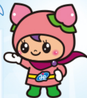
赤磐市社協マスコット こもちゃん

行政をはじめ関係機関や団体、教育機関、福祉施設、事業所等と連携し、地域の皆様と一緒に、誰もが安心して暮らしていくことができるまちづくりをめざし、住民皆様からいただいた社協会費や共同募金、寄付金を財源として様々な地域福祉活動に取り組んでいます。