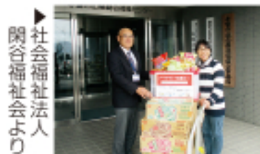
社会福祉法人 関谷福祉会より

赤磐市社会福祉法人連絡会加入の13法人より食料寄付をいただきました。誠にありがとうございました。