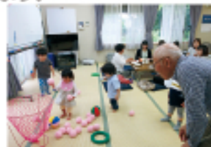
▲ふれあいサロン (三世代交流)

在宅で生活する75歳以上のひとり暮らし高齢者の見守り・安否確認などを行っています。