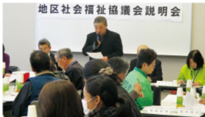
▲桜が丘東地区 地区社協説明会の様子