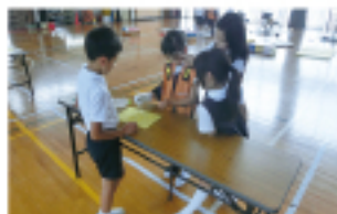
出前福祉講座 (高齢者疑似体験)