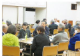
▲地区社協説明会 (話し合いの様子)