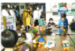
▲育児用品無料交換会の様子

参加者のかたからは「初めて参加しましたが、希望する育児用品が交換できて良かったです」「盛況ぶりに驚きました」などの声がありました。今年度の開催予定については赤磐市社会福祉協議会の広報紙「福祉のひろば」やホームページ等でお知らせいたします。