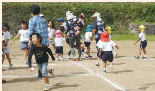
▲ふれあい交流事業の様子