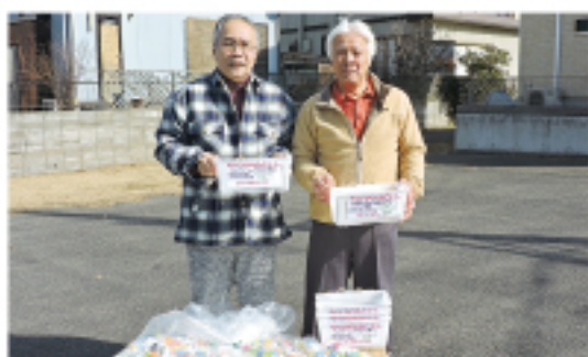
▲「一歩一会」のメンバー