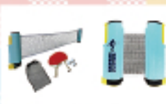
ドコデモピンポン

この他にも幼児からお年寄りまでが楽しめるレクリエーション用品を取り揃えています。お気軽にお問い合わせください。