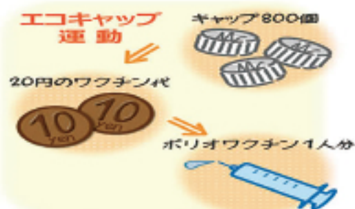
▲ワクチンへの流れ