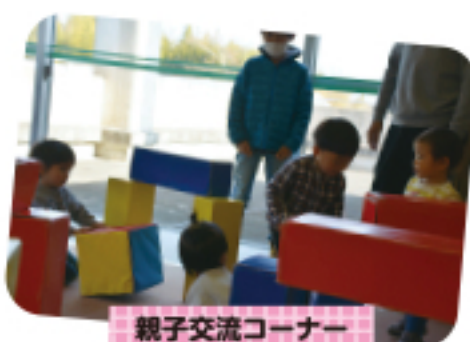
親子交流コーナー