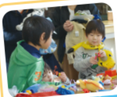
おもちゃコーナー

発行/編集 社会福祉法人 赤磐市社会福祉協議会 ☎ (086) 955-8777 Fax (086) 955-7788 〒709-0821 岡山県赤磐市河本778-1 ✉ : akaiwasha@mx6.tiki.ne.jp ホームページアドレス : http://www.akaiwashakyo.or.jp