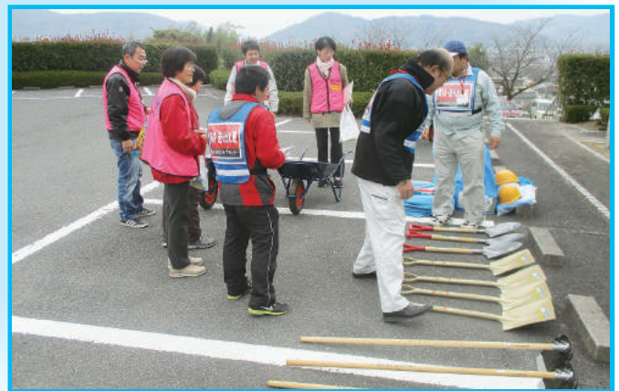
ボランティアへ活動資材の受け渡し

11月26日（日）、山陽総合福祉センターにて「平成29年度災害ボランティアセンター設置・運営訓練」を行いました。市内外より49名のかたが参加され、当日は赤磐市内において、豪雨による災害が発生した想定の中で、訓練を行いました。参加者からは「他人ごとではなく、自分のこととして考えようと思いました。」「訓練に参加することで、災害ボランティアセンターの運営について理解ができ、大変参考になりました。」などの意見・感想を多くいただきました。