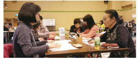
▲グループワークの様子