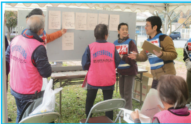
ボランティアの活動調整