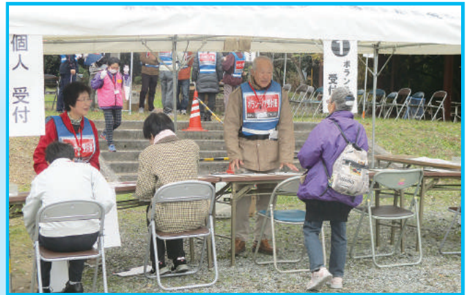
ボランティアの受付