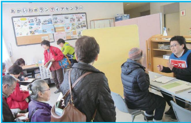
被災者の困りごと受付