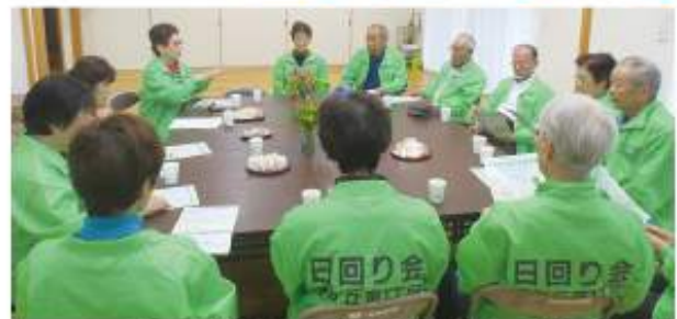
▲ サロン後の日回り会話し合いの様子

日回り会の皆さんに活動していくうえで良かったこととお聞きすると、「以前よりも地域の高齢者やご近所との会話が増えました。」「活動を行うことで地域の防犯にも役立っており、今後も地域の見守りの輪を長く続けていきたい。」とお話ししてくださいました。