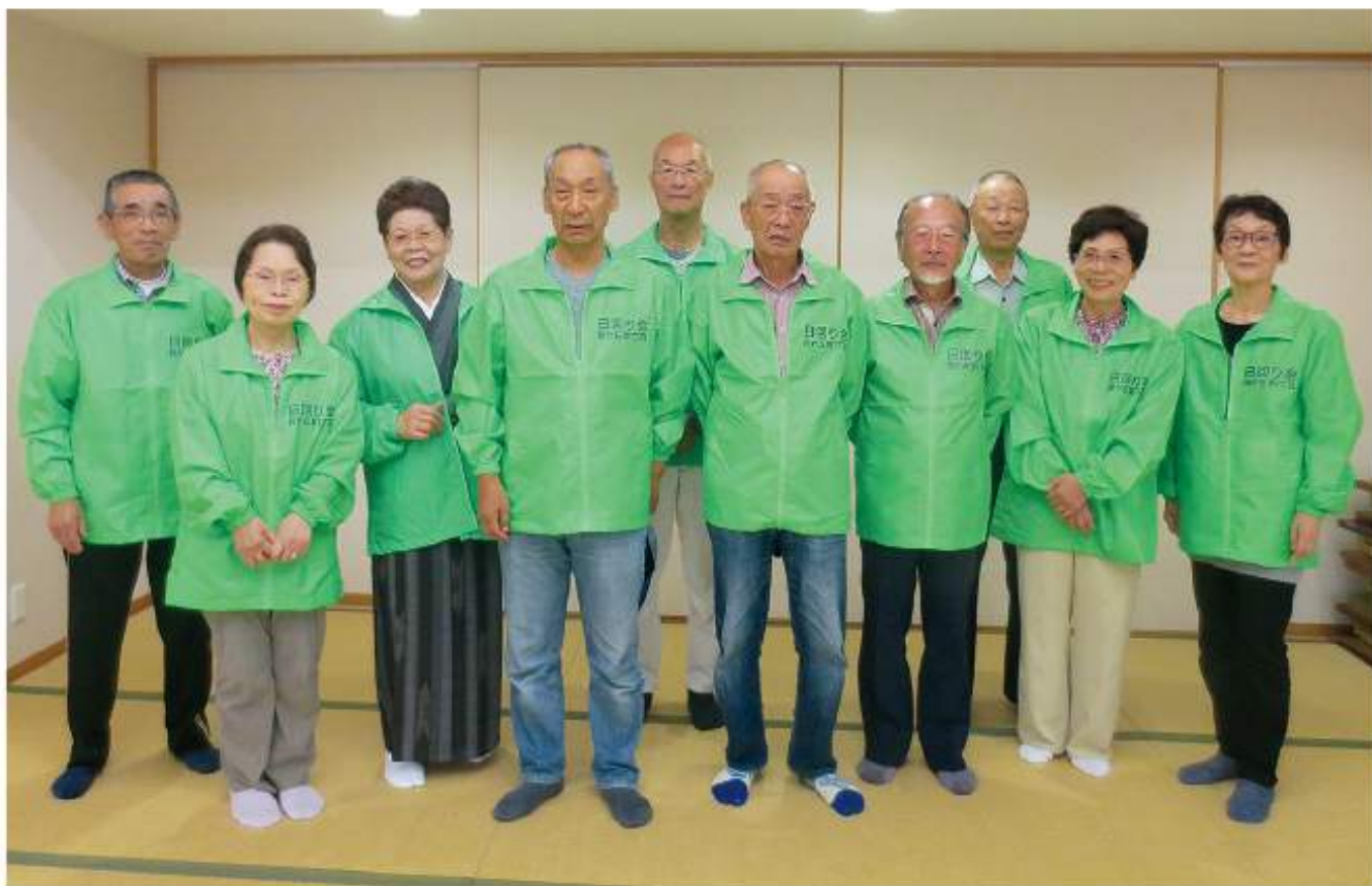
▲ 桜が丘東1丁目「日回り会」 ひまわ

発行／編集 社会福祉法人 赤磐市社会福祉協議会 ☎ (086) 955-8777 Fax (086) 955-7788 〒709-0821 岡山県赤磐市河本778-1 ✉ : akaiwasha@mx6.tiki.ne.jp ホームページアドレス : http://www.akaiwashakyo.or.jp