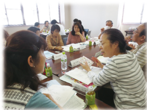
▲ 熊山地域 5月23日（火）グループワークの様子

また、赤坂・熊山地域では、地域における見守りネットワークの構築に向けて、互いに区内での見守り・声かけ活動やふれあいサロンなどについて、どのような連携が図れるのか熱心に話し合いが行われました。