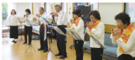
◀ 高齢者施設にて演奏会

A. オカリナの演奏を通じて、地域のかたとふれあいたいという思いからグループが立ち上がりました。