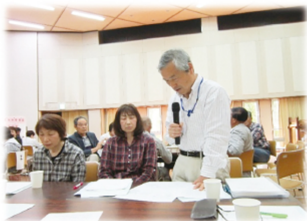
▲ 赤坂地域 5月11日（木）グループワークの様子