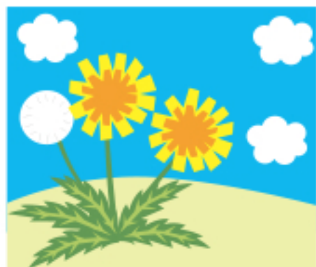
韓国語教室「サランバン」

「福祉のひろば」に皆様のご意見・ご感想をお寄せ下さい。 宛先 〒709-0821 赤磐市河本778-1 赤磐市社会福祉協議会 本所(代表) ☎955-8777 地域福祉課 ☎955-8877 赤坂事務所 ☎957-2334 熊山事務所 ☎995-2336 吉井事務所 ☎954-2533