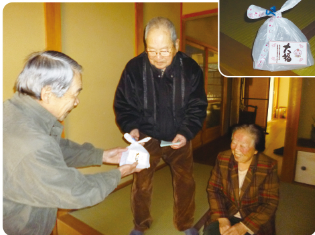
▲ 友愛訪問（佐伯北地区社協）

発行／編集 社会福祉法人 赤磐市社会福祉協議会 ☎ (086) 955-8777 FAX (086) 955-7788 〒709-0821 岡山県赤磐市河本778番地1 メールアドレス：akaiwasha@mx6.tiki.ne.jp ホームページアドレス：http://www.akaiwashakyo.or.jp/