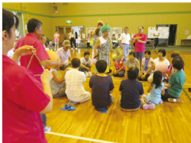
▲ かみなりさまゲーム