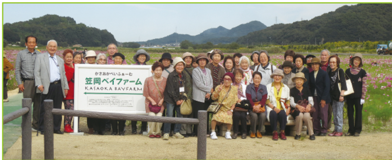
▲ 道の駅笠岡ベイファーム

発行／編集 社会福祉法人 赤磐市社会福祉協議会 ☎ (086) 955-8777 FAX (086) 955-7788 〒709-0821 岡山県赤磐市河本778番地1 メールアドレス：akaiwasha@mx6.tiki.ne.jp ホームページアドレス：http://www.akaiwashakyo.or.jp/