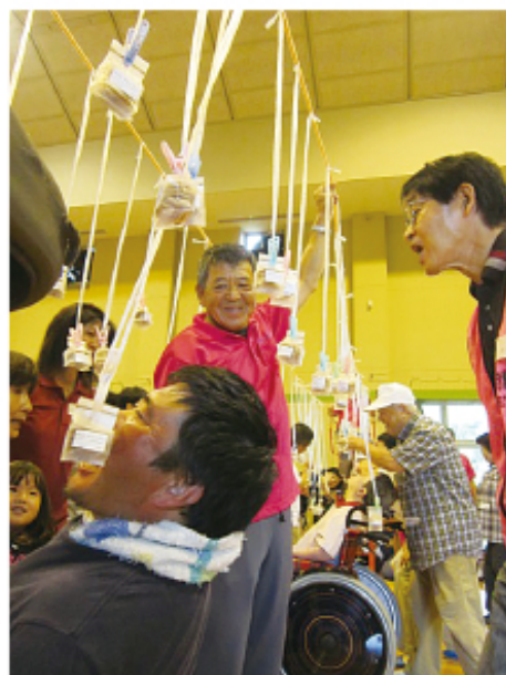
▲ クッキー食べて メダルをゲット！

当日お寄せいただきました。義援金6,909円は、岡山県共同募金委員会で取りまとめの上、熊本県が設置する義援金配分委員会を通じて被災者支援に使わせていただきます。