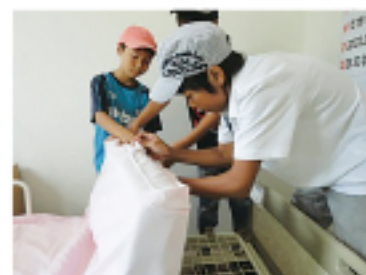
▲ シーツ交換のお手伝い

職員のかたは、利用者さんの様子を気にかけてくださるので、掃除もしなければならぬので、大変そうでしたが、利用者さんから「ありがとう」と言ってもらえるので、やりがいのある仕事だと思いました。