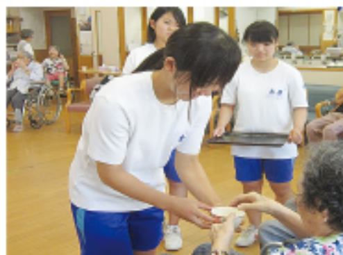
▲ お茶出し (春の家デイサービスセンター)