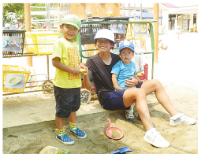
▲ 砂場遊び (さくらが丘保育園)