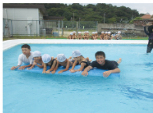
▲ プール遊び (石相保育園)