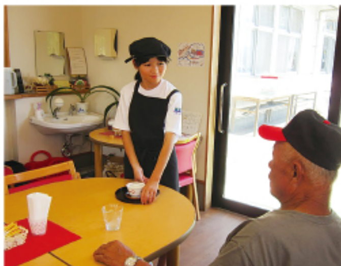
▲ カフェでのお茶出し (わかたけ作業所)