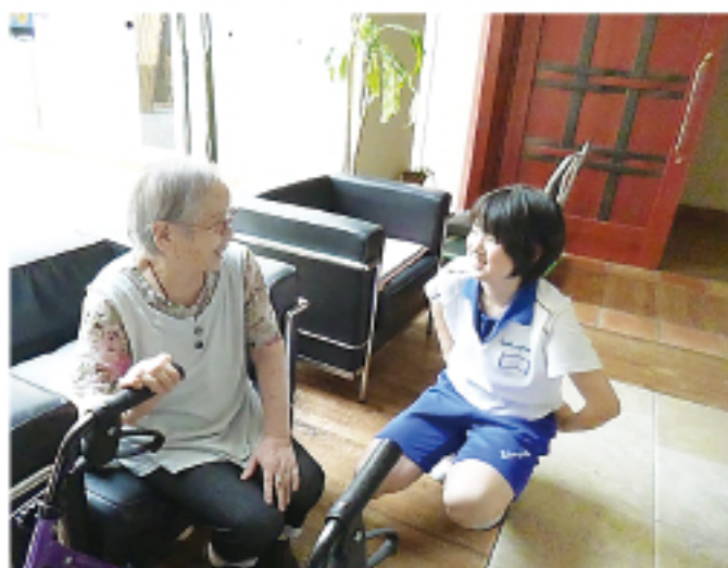
▲ 談笑 (ケアハウスローズガーデン)