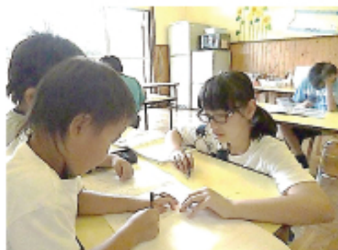
▲ 放課後児童クラブでの宿題のお手伝い (城南ふれあいクラブ)