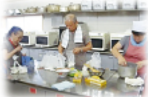
▲ 高月地域防災訓練