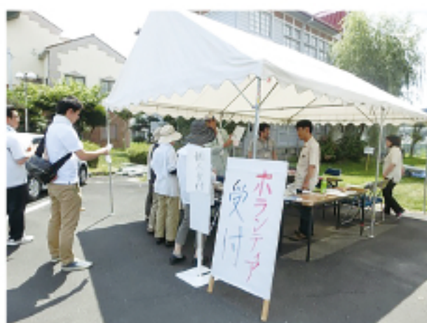
▲ 設置訓練 (災害ボランティアの受付)