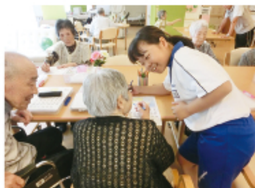
▲ 塗り絵のお手伝い (ルミエール桜が丘)