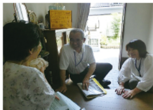
▲ 民生委員同行による友愛訪問の様子

そのためにも、この人だったら話ができる、困りごとを聞いてもらえると思うてもらえるような関係づくりから始めていきたいと思っています。