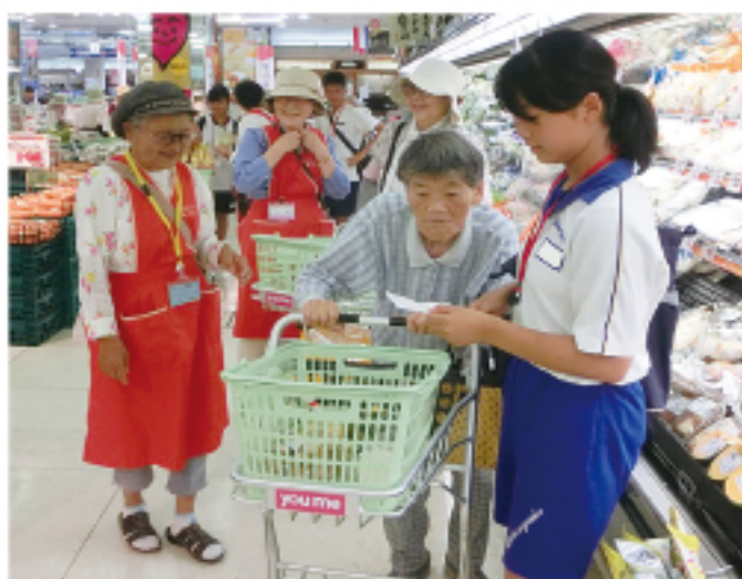
▲ 買い物のお手伝い (福祉ボランティア「虹の会」)