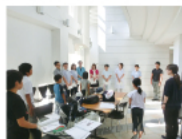
▲ 施設職員のかたのお話

施設には、いろいろな職種の人が働かれています。ご利用者さんが安心・安全に暮らせるように工夫されていることが分かりました。