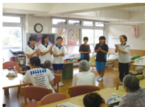
▲ 手遊び (デイサービスセンターひろむし)