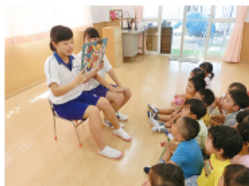
▲ 紙芝居の読み聞かせ (清風いろは保育園)