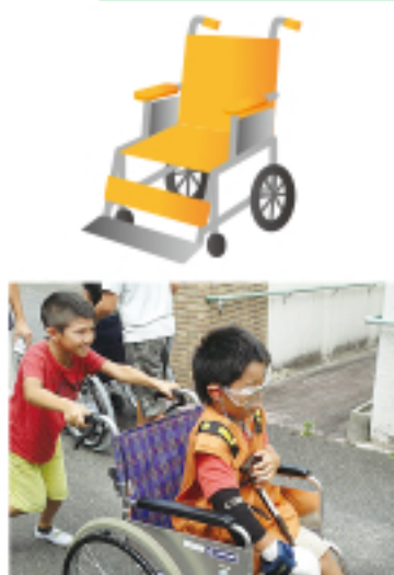
▲ 車いす体験・高齢者疑似体験

職員のかたは、利用者さんの様子を気にかけてくださるので、掃除もしなければならぬので、大変そうでしたが、利用者さんから「ありがとう」と言ってもらえるので、やりがいのある仕事だと思いました。