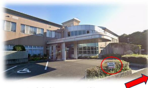
▲山陽総合福祉センター外観

※1階正面玄関は施錠しています。 地階入口（赤磐市社会福祉協議会の 標識あり）からお入りください。